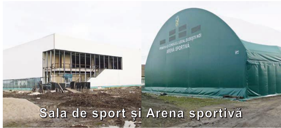
Sala de sport și Arena sportivă

În încheiere, vă doresc ca sărbătoarea Crăciunului să