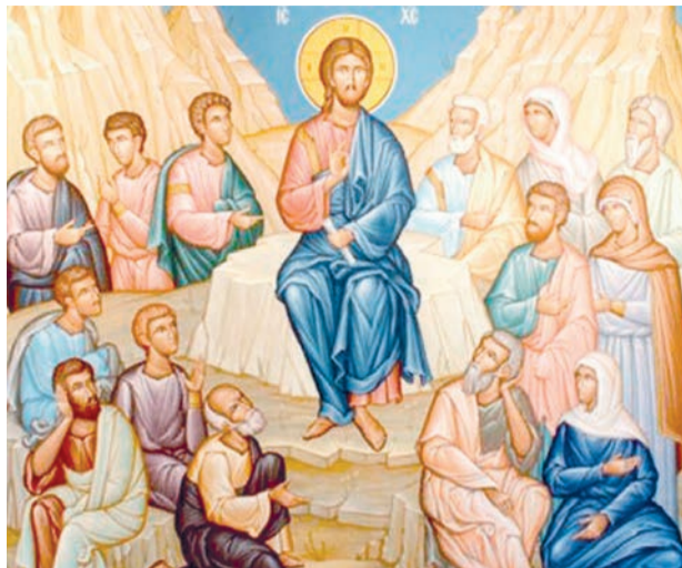
Sinaxarul din Duminica Rusaliilor

În biserici se aduc de Rusalii frunze verzi de tei sau de nuc, care se binecuvântează și se împart credincioșilor, simbolizând limbile de foc ale puterii Sfântului Duh, Care S-a pogorât peste Sfinții Apostoli.