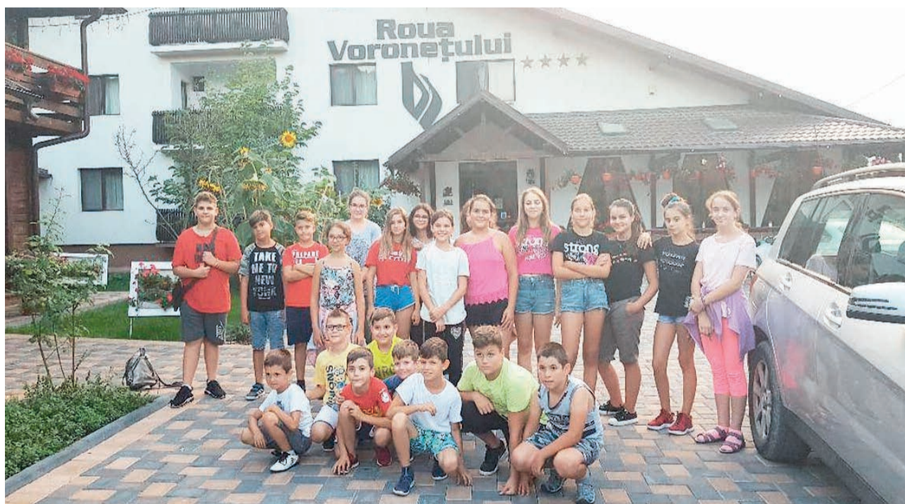
Scaun a Sucevei -, precum și pe cea de la Mănăstirea Voroneț.

Dintre excursiile organizate în zonă o amintim pe cea de la Suceava - unde au vizitat Observatorul Astronomic, Muzeul Satului Bucovinean și Cetatea de