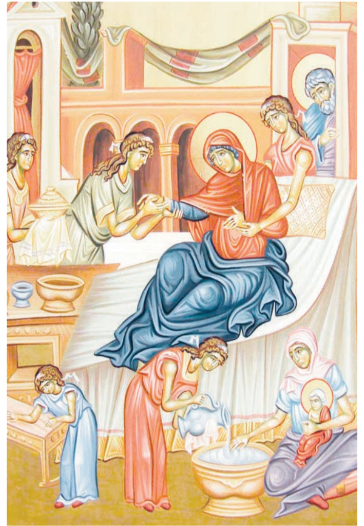
Maicii Domnului la Ierusalim, de către împărăteasa Eudoxia, la începutul secolului al V-lea.

În Apus, sărbătoarea a fost adoptată în timpul Papei Serghe I (687-701). În secolul al VI-lea, Sfântul Roman Melodul a compus condacul și icosul acestui praznic, iar în secolul al VIII-lea, Sfântul Ioan Damaschin a alcătuit Canonul ce se cântă la slujba Utreniei. Data de 8 septembrie, aleasă pentru prăznuire, reprezintă ziua sfințirii unei biserici închinată