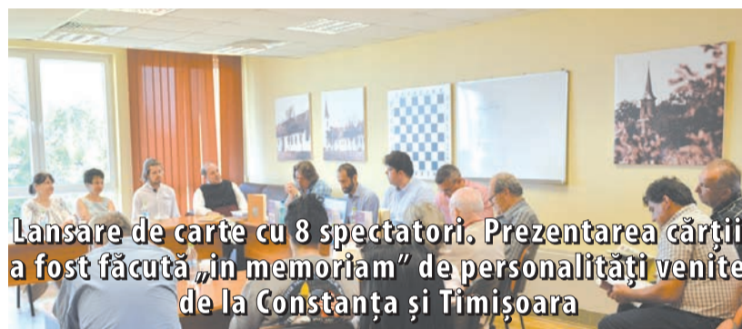
Lansare de carte cu 8 spectatori. Prezentarea cărții a fost făcută „in memoriam” de personalități venite de la Constanța și Timișoara

În domeniul comerțului îi avem pe Iorgu Steriu (comerciant), Nicolae Malaxa (industriaș), Stere Farmache (economist, fost director al Bursei de Valori București), Evanghelie Zappa. În politică putem începe cu Eugeniu Carada, Eftimie Murgu (jurist, profesor de filozofie, om politic), Octavian Goga (poet, fost prim-ministru), Emanuil Gojdu (avocat de succes și patriot ardelean), Constantin