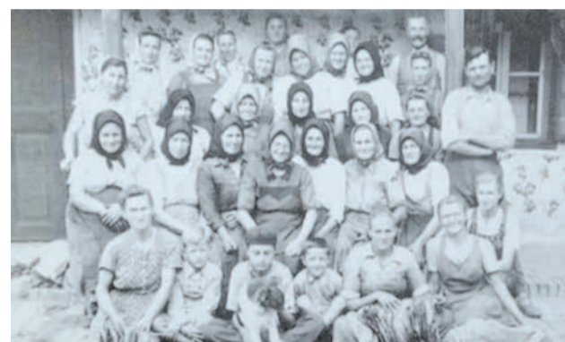
Uscatul frunzelor de tutun la Colectiv - 1959

că familiile duse cu forța în Bărăgan au dreptul să se întoarcă acasă, acestea și-au găsit casele ocupate și transformate în diferite sedii ale întreprinderilor statului sau magazii, fiind nevoite să caute găzduire la străini. Cele mai multe case au fost distruse în mod barbar, unele au fost cu greu recuperate de proprietarii lor de drept, dar cea mai mare parte a bunurilor confiscate cu forța nu au mai fost redobândite niciodată.