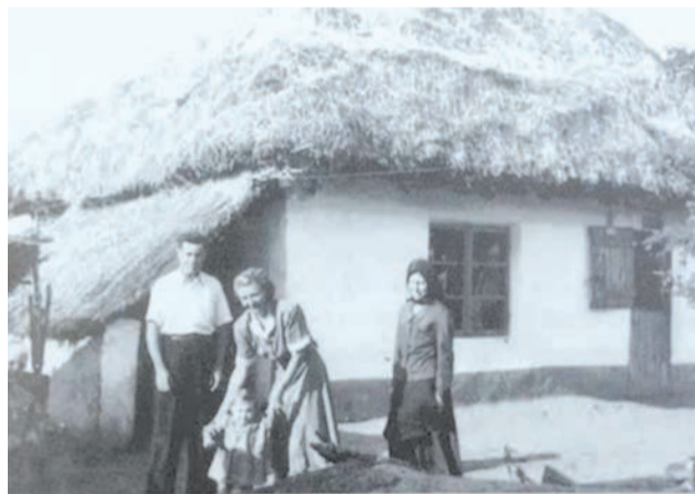
Familia Rotaru și Casa din Dropia - 1956

Cei mai mulți deportați germani nu proveneau însă