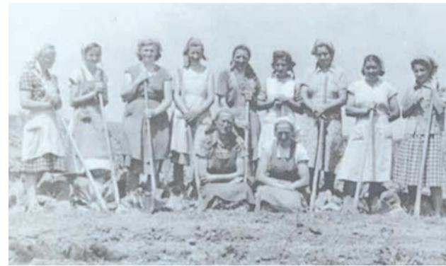
La grădinărit - 1958

Din ordinul autorităților, care le-au furnizat lemn de construcție, ferestre și uși rudimentare și cuie, au început să-și ridice case cu pereți de pământ amestecat cu paie și au construit instituțiile din fiecare comună. Deportații aveau domiciliu obligatoriu iar zona în care fuseseră mutați cu forța era atent supravegheată de autorități. Cei mai mulți munceau în fermele de stat, pe plantații, în construcții sau la amenajarea sistemului de irigații din zonă, unii prestau diverse munci la domiciliu sau altele ocazionale. În cei aproape cinci ani de domiciliu obligatoriu în „satele noi”, adevărate lagăre de muncă, coletele trimise deportaților au fost confiscate iar aceștia n-au avut voie să primească nici scrisori, nici vizite. După ce partidul comunist a decis