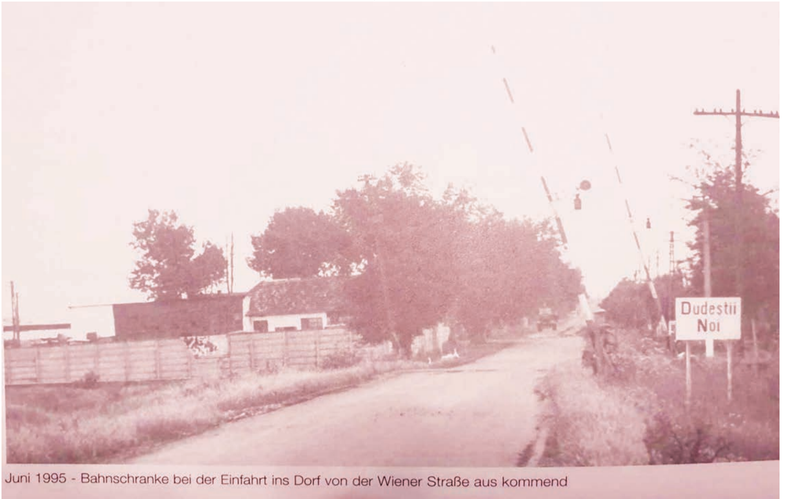
Juni 1995 - Bahnschranke bei der Einfahrt ins Dorf von der Wiener Straße aus kommend